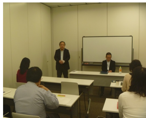
理事長による冒頭の挨拶

10月12日（土）札幌市民交流プラザにて、NPO法人キャリア・カウンセラー札幌第10回講演会を開催いたし、約20名のご参加を頂きました。