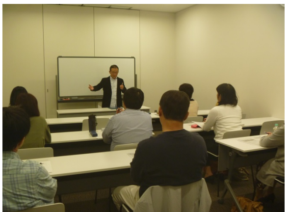
池田講師による対話形式の講演