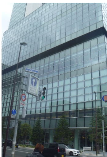
講演会場の「市民交流プラザ」