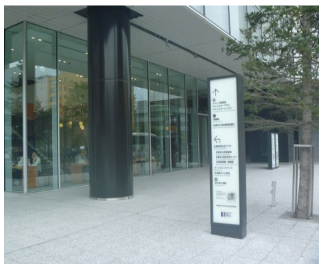
市民交流プラザの入り口